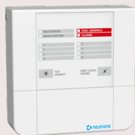
Tableau de synthèse secouru type Pr