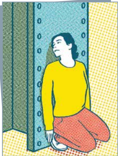
Se cacher derrière des obstacles solides