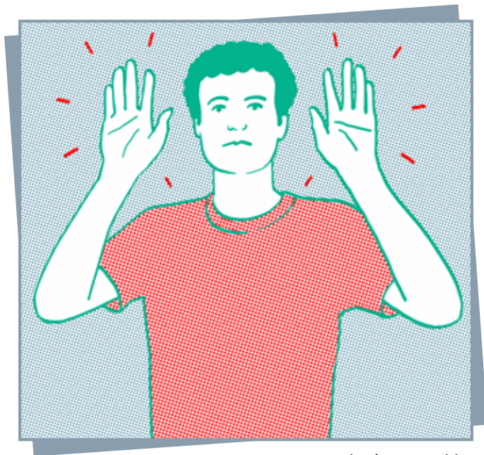
Mains levées et visibles